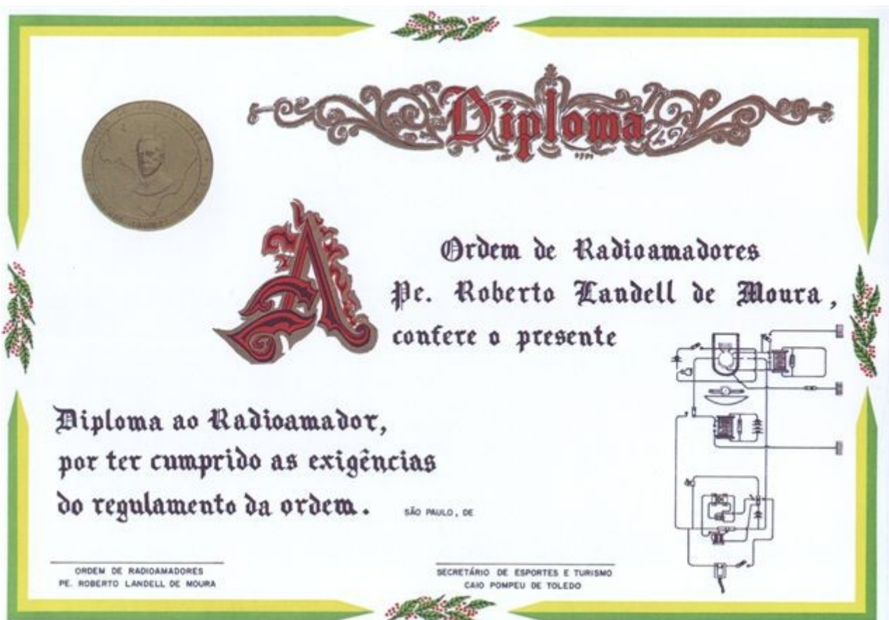
PRL-Grund/"Einstiegs" - Diplom