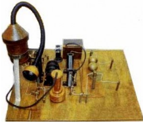
Pater Roberto Landells Funkgerät (Nachbau)